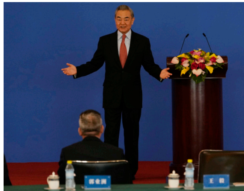
Kinas utrikesminister Wang Yi.

I november besöker bistånds- och utrikeshandelsminister Benjamin Dousa Kina. Det är det första svenska ministerbesöket i landet på sex år. Dousa träffar sin kinesiske motpart Wang Wentao och representanter från näringslivet för att diskutera utvecklingen av den bilaterala handeln. Han besöker även den stora handelsmässan China International Import Expo i Shanghai. I Kina beskrivs besöket främst som ett sätt att främja handeln och det ekonomiska utbytet mellan Kina och Sverige, och medierna lyfter fram Dousas kritiska inställning till EU-kommissionens tullar på kinesiska elbilar.