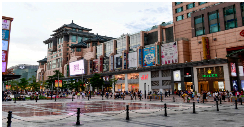
Gågata i Peking.

Det ska dock poängteras att de svenska företagen i Kina på det stora hela prioriterar en fortsatt närvaro i landet. 90 procent av företagen rapporterar att de inte har upplevt någon form av "frikoppling" mellan sina huvudkontor och Kina. Flera företag meddelar även expansionsplaner och bolagsförvärv under året. ABB, som invigde en megafabrik i Shanghai 2022, meddelar i maj att det köper Siemens kablageverksamhet i Kina. Sandvik köper en majoritetspost i det kinesiska verkstadsföretaget Suzhou Ahno, och AstraZeneca meddelar planer på att öppna ett nytt globalt strategicenter i Shanghai. Enligt Business Sweden lockar den kinesiska marknaden fortsatt på grund av dess storlek, tillväxtpotential och låga produktionskostnader.