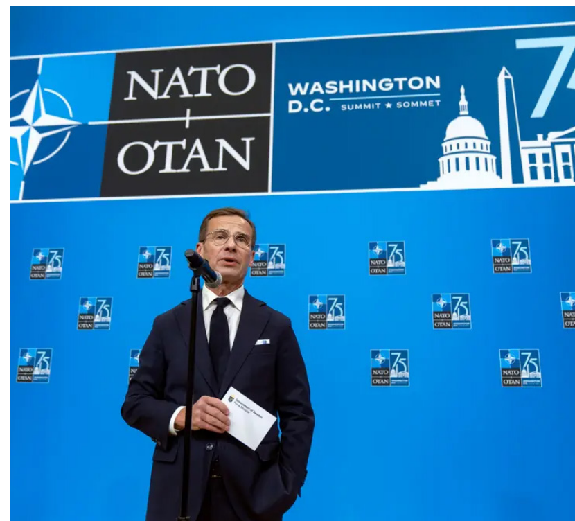
Statsminister Ulf Kristersson på NATOs toppmöte i Washington.

Kina har å sin sida blivit alltmer negativt inställt till Nato, som en följd av att alliansen i sin officiella kommunikation beskriver landet som en utmaning.