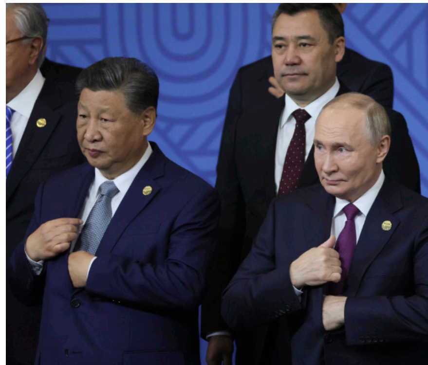
Xi Jinping och Vladimir Putin på årets BRICS-möte.

I slutet av året inträffar händelser som väcker nya frågor om omfattningen av det kinesisk-ryska samarbetet. I november uppstår återigen skador på undervattenskablar i Östersjön. Likt incidenten i oktober 2023, då två kablar och en gasledning skadades, misstänks det röra sig om medvetet sabotage. Det kinesiska fartyget Yi Peng 3 pekats ut som huvudmisstänkt och ankrar i dansk ekonomisk zon i Kattegatt medan förhandlingar om ombordstigning förs med den kinesiska regeringen. Fyra veckor efter incidenten genomför ett kinesiskt utredningsteam en undersökning ombord på fartyget. Statens haverikommission och svensk polis närvarar som "observatörer". Kina tillåter dock inte polisen att genomföra några utredande åtgärder inom ramarna för den svenska brottsutredningen om misstänkt sabotage av kablarna. Den 21 december seglar fartyget vidare. Det har fortfarande inte offentliggjorts några bevis inom utredningen för att det rör sig om sabotage och vem som i så fall är ansvarig, men flera bedömare menar att Ryssland troligtvis ligger bakom. Om det rör sig om ryskt sabotage kvarstår frågan om den kinesiska staten också är inblandad.